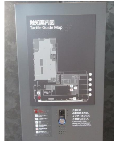
インターホン付き触知案内図

また、障害特性により、窓口での手続きが難しいお客様には、個別に話を伺い、お客様に負担がかからないように配慮しています。