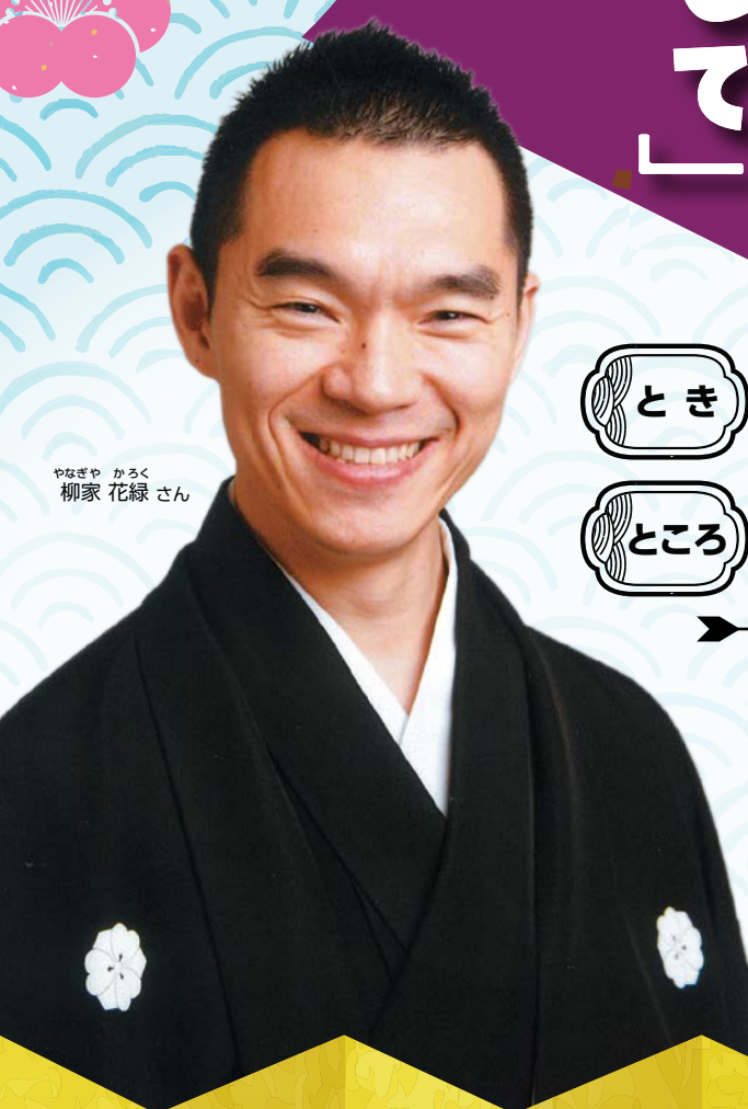
やなぎや かるく 柳家 花緑 さん